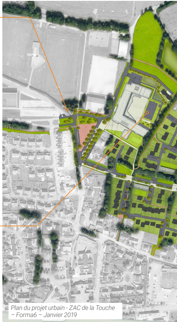
Plan du projet urbain - ZAC de la Touche - Forma6 - Janvier 2019

Le collège est réalisé par le Département d'Ille-et-Vilaine. Cet équipement a fait l'objet d'un concours remporté par l'équipe d'architectes PELLEAU et associés et MICHOT Architectes. Le projet retenu s'attache tout particulièrement à la fonctionnalité, à la durabilité du bâtiment et aux enjeux environnementaux en général, dont la limitation de son impact sur la faune et la flore.